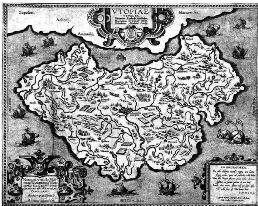
Utopía (Abraham Ortelius 1595)