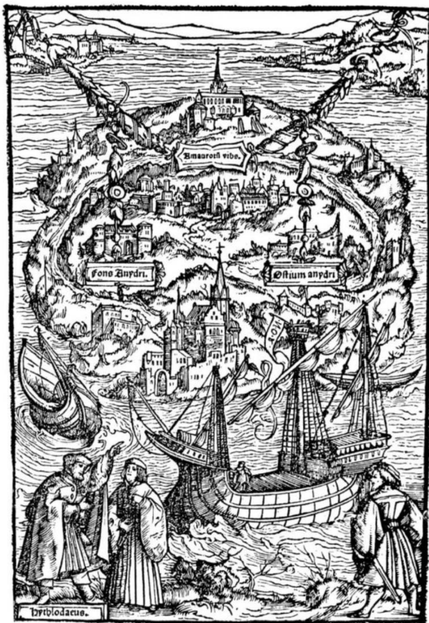
Utopía: ilustración de la edición de 1518 (A. Holbein)