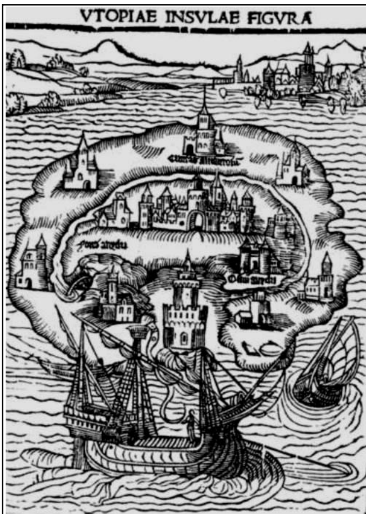
Utopía: ilustración de la primera edición, 1516